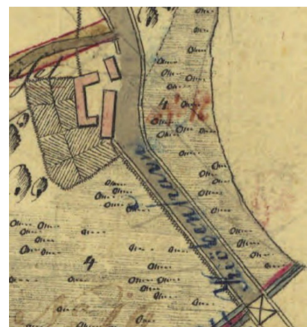
Udsnit af matrikelkort, hvor det tidligere Krebshus er indtegnet. Kortet er opmålt i 1793 og tegnet i 1805.

Krobygningen blev revet ned i 1924. Samtidig blev der bygget en ny villa på den nordlige side af vejen. Det blev til den nuværende Krebshuskro. Hele området var på den tid ejet af Sorø Kloster og Akademi.