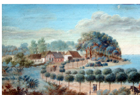
Akvarel: Krebshuset omkring 1790 set fra rundingen.

Kilder: Geodatastyrelsen, Ad hjulspor og landeveje af Torben Topsøe-Jensen (1908-1993), 1966; Dansk Vejtidskrift, marts 1952 og Gamle landevejskroer fra København til Korsør af Aage Welblund og Arthur G. Hassø, 1946; Lokalhistorisk Arkiv for Sorø og omegn: Sorø Leksikon. Akvareller tilhørende Sorø Akademi