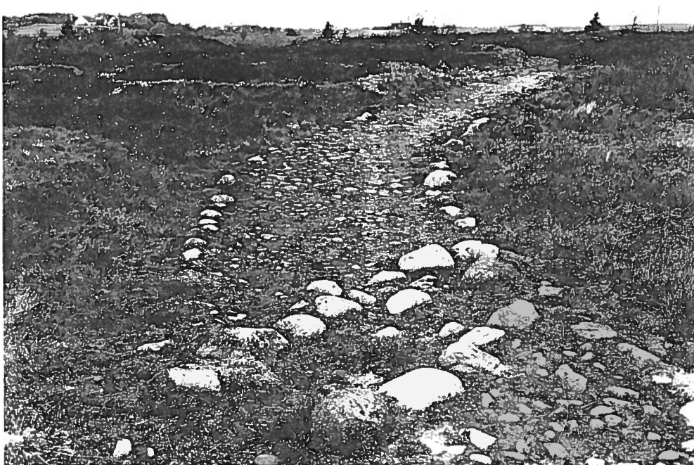
Stenbelagt vej ved Borremose

Vi kører derfor fra Viborg mod nord ad rute 13 til Løvel bro over Skals Å. Her vil arkæo- log Jens Velle fortælle om de undersøgelser/udgravninger, han var med til at gennemføre i 1992. Løvel bro er en stenbro og sikkert opført i midten af 1200-tallet. Den skulle have været 14 m lang og 2,5 m høj på midten.