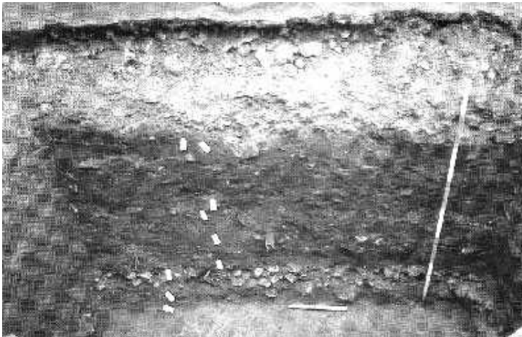
Et typisk profil i Algade i Roskilde. Nederst er stenlagsbelægningen fra ca. 1300 og derover er de tykke uomsatte møddingslag, der er ældre end ca. 1450. Direkte på dem hviler de moderne gadelag.

I foredraget kommer Hanne Dahlerup Koch bl.a. ind på gadernes fysiske udformning (gadebelægninger, rendestene, fortov etc.). Endvidere vil hun berette om gadernes ejerforhold, hvordan gadernes anlæggelse, vedligeholdelse og renholdelse blev (forsøgt) administreret, og på lovgivningen herom, samt på hvilke genstande man finder og ikke finder, når man graver i gaderne.