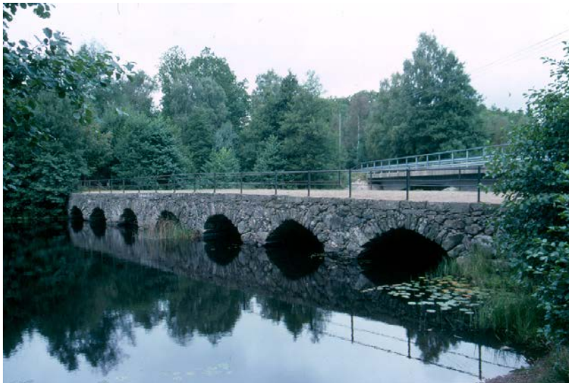
Stenbro i Svinaberga nær Älmhult i Småland, ca. 1820.