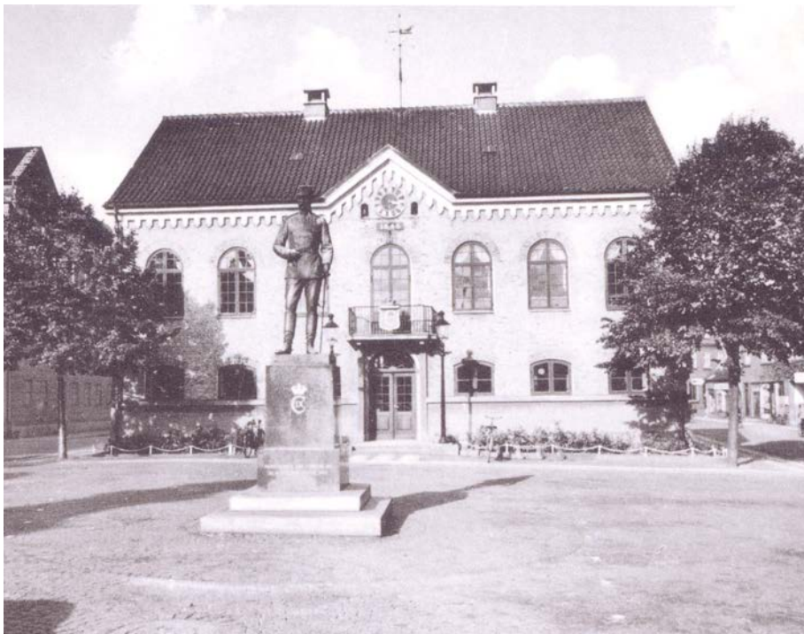
Fotoet fra 1955 viser i forgrunden den nedfældede 0-kilometersten på Torvet i Nykøbing Mors

skulle nu erstattes af kilometersten og der blev derfor foretaget en opmåling af samtlige landeveje. Det resulterede i opsætningen af nye kilometersten, hvor iøvrigt nogle af de gamle milesten blev genbrugt.