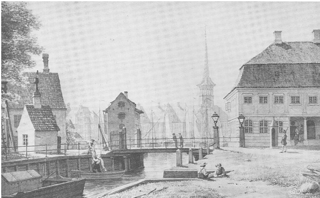
Indgangen til Gammelholm fra Holmens Kanal. Til højre Gammelholms Hovedvagt. Midt i billedet broen over Holmens Kanal og i baggrunden Børsen. Tegning fra 1861. Fra København før og nu – og aldrig.

Også hans plan fra 1859 blev justeret – med større bebyggelsestæthed og sløjfning af de foreslåede friarealer som følge. Byggeriet startede i midten af 1860'erne og hele området var færdigbygget i 1876 – primært med boliger. Området endte med den højeste bebyggelsesprocent i København: mere end 400.