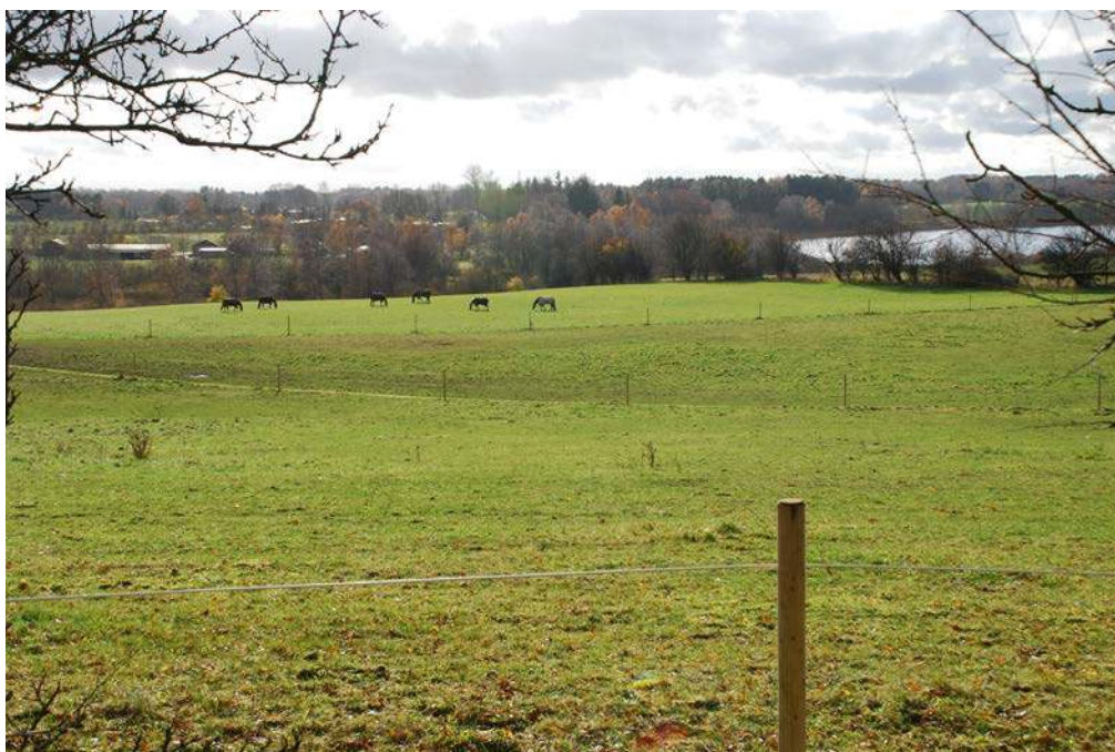
Transportkorridoren passerer her Mølleådalene mellem Bastrup Sø og Farum Sø. Passagen af Mølleådalene kan blandt andre blive en "tung sag".

Er der i overskuelig tid overhovedet brug for transportanlæg i de udlagte korridorer og kan eller skal store fremtidige infrastrukturanlæg overhovedet placeres i de reserverede transportkorridorer, hvis de bliver til noget?