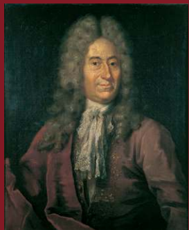
Ole Rømer 1644-1710

Den store videnskabsmand fik store offentlige opgaver, efter han gennem astronomiske målinger påviste lysets hastighed.