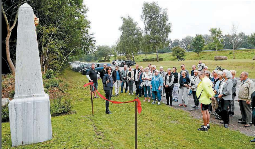
Borgmesteren i Lejre kommune indvier en nyrestaureret milesten - ligeledes et eksempel på et samarbejde, milestensgruppen har deltaget i.

Deltag aktivt i bevaringsarbejdet gennem Dansk Vejhistorisk Selskab