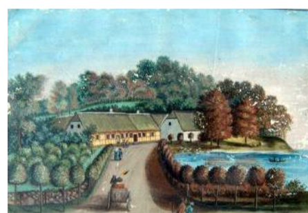
Akvarel: Krebshuset omkring 1800 set fra rundingen.