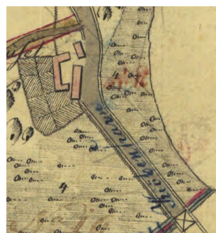
Udsnit af matrikelkort, hvor det tidligere Krebshus er indtegnet. Kortet er opmålt i 1793 og tegnet i 1805.

Krobygningen blev revet ned i 1924. Samtidig blev der bygget en ny villa på den nordlige side af vejen. Det blev til den nuværende Krebshuskro. Hele området var på den tid ejet af Sorø Kloster og Akademi.