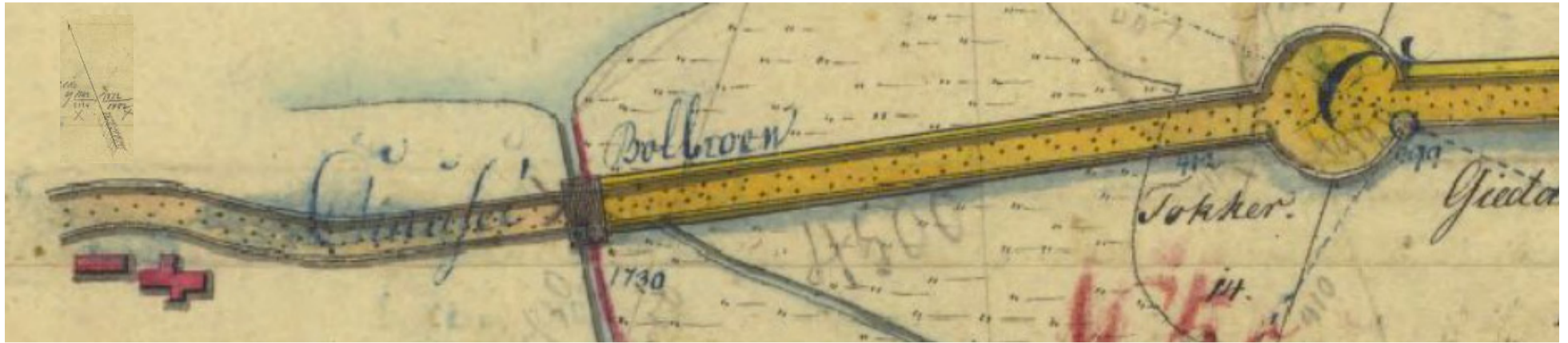
Udsnit af matrikelkort. På kortet kan man læse, at broen over Tuel Å hed Bolbroen. Kortet er forfattet i 1784 og kopieret i 1805.

Krebshusalléen: Frederik d. V besluttede i 1761, at der skulle anlægges nye hovedveje i alle landets provinser.