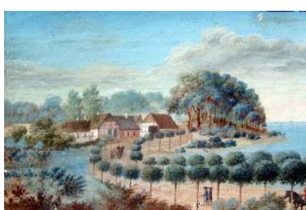
Akvarel: Krebshuset omkring 1790 set fra rundingen.

Kilder: Geodatastyrelsen, Ad hjulspor og landeveje af Torben Topsøe-Jensen (1908-1993), 1966; Dansk Vejtidskrift, marts 1952 og Gamle landevejskroer fra København til Korsør af Aage Welblund og Arthur G. Hassø, 1946; Lokalhistorisk Arkiv for Sorø og omegn: Sorø Leksikon. Akvareller tilhørende Sorø Akademi