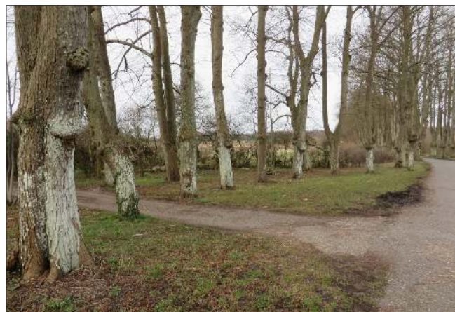
Den sydlige del af Rundingen. April 2016.

Og her mødtes vognmændene fra Ringsted og udvekslede fragtgods, post og passagerer med vognmændene fra Slagelse. Vognmændene fra Ringsted besørgede fragtkørslen fra Benløse Runding nord for Ringsted og til Slaglille Runding. Vognmændene fra Slagelse klarede trafikken mellem Slaglille Runding og Korsør.