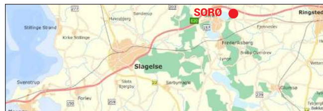
Krebshusalléen. Kort: Geodatastyrelsen.

Udgivet i 2017 af Sorø Kommune i samarbejde med Dansk Vejhistorisk Selskab og Danmarks Naturfredningsforening, Sorø.