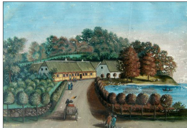
Krebshuset omkring 1800 set fra rundingen. Akvarel: Stiftelsen Sorø Akademi.

på begge sider var hver 4 alen brede. Til orientering i tåge og snefog og for at give skygge om sommeren plantedes træer langs vejen, således som man stadig kan se her på Krebshusalléen.