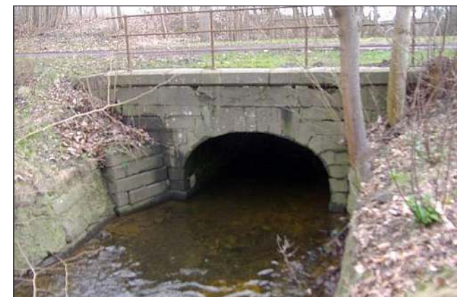
Nordsiden af broen over Skovse Å. Marts 2017. På den ene facade står der "kongekrone C VII 1781" og "SKOVSE" på den anden side.

ældste lovgivning. Men vejenes tilstand kunne være meget slet, da der jo var tale om simple jordveje, som let opkørtes under tørt og stærkt regn. Af den grund fik både Frederik 2. og Christian 4. anlagt veje - såkaldte kongeveje - der alene var forbeholdt kongens og hoffets brug. For alle andre var der forbud mod at befærde kongevejene, og overtrædelse kostede strenge straffe. Allerede forud for anlæggelsen af chausséerne - antagelig omkring 1611-13 - blev Krebshusalléen en del af den kongevej, som Frederik 2. og senere Christian 4. anlagde til Antvorskov Slot (tidligere Antvorskov Kloster) syd for Slagelse. Ved Bolbro opførtes i 1639-40 en bolig til den vejopsynsmand, der skulle have indseende med, at ingen uvedkommende "tilfordristede" sig til at køre på kongens vej. Hans årsløn skulle være 40 kurantdalere. Yderligere fik han 40 sletdalere i bonus for hver hest, han skød, når uberettigede havde vovet sig ind på kongevejen.