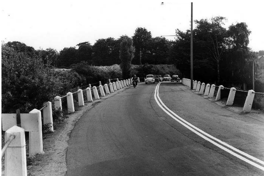
Figur 2. En mere moderne udgave af sikkerhedsrækværk havde erstattet kampesten med betonstøbte piller. De udgjorde dog stadig en stor fare ved påkørsel, som her ved overføring af jernbane i Sct. Jørgensgade i Odense i 1971.