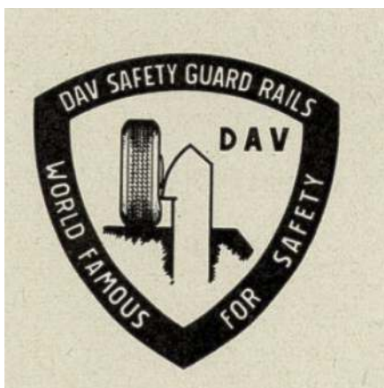
Figur 1. Firmaet Dansk Auto Værn markedsførte autoværnet internationalt med dette bomærke i 1960'erne. Tegningen symboliserer autoværnets evne til at rette vildfarende køretøjers retning.

værkets sten var skyld i mange uheld. Rasmussen byggede sit sikkerhedsrækværk i beton – hvide betonbjælker på pæle, som vi kender dem fra mange danske veje i dag. Betonbjælkerne havde en buet profil for at kunne rette en bils forhjul op, så bilen ændrede kørselsretning væk fra afgrunden.