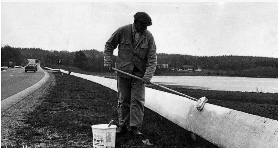
Figur 3. Maling af autoværn hører med til den jævnlige vedligeholdelse.

Autoværnene solgte dog ikke sig selv, så der skulle informeres om produktet. Han havde i 1939 fået vejmyndigheder til at sætte autoværnet op ni steder, og nu var tiden moden til for alvor at gøre folk opmærksom på produktets værdi. Han fik tilladelse til at opsætte autoværn ved en jernbaneoverføring i Helsingør, hvor en ret stejl vej førte ned til Færgevejen. En lang række af landets eksperter var indbudt til at se forsøg med påkørsel med både personvogne og lastbiler. "Man føler sig usikker og frygtosom, når der køres langs en række granit- eller betonstolper, men langs et autoværn vil man føle sig tryk." lød en bedømmelse fra en af tilskuerne.