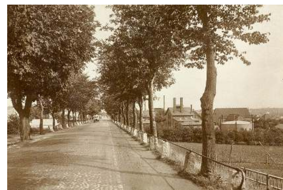
Figur 7. Silkeborgvej ved Åbyhøj havde i 1925 det udbredte sikkerhedsrækværk med jernrør fastspændt på store sten.

I længden kunne patentet ikke beskytte DAV. Blandt andet markedsførte firmaet Nordisk Autoværn i 1960'erne et autoværn i beton, som dog havde to vandrette bjælker.