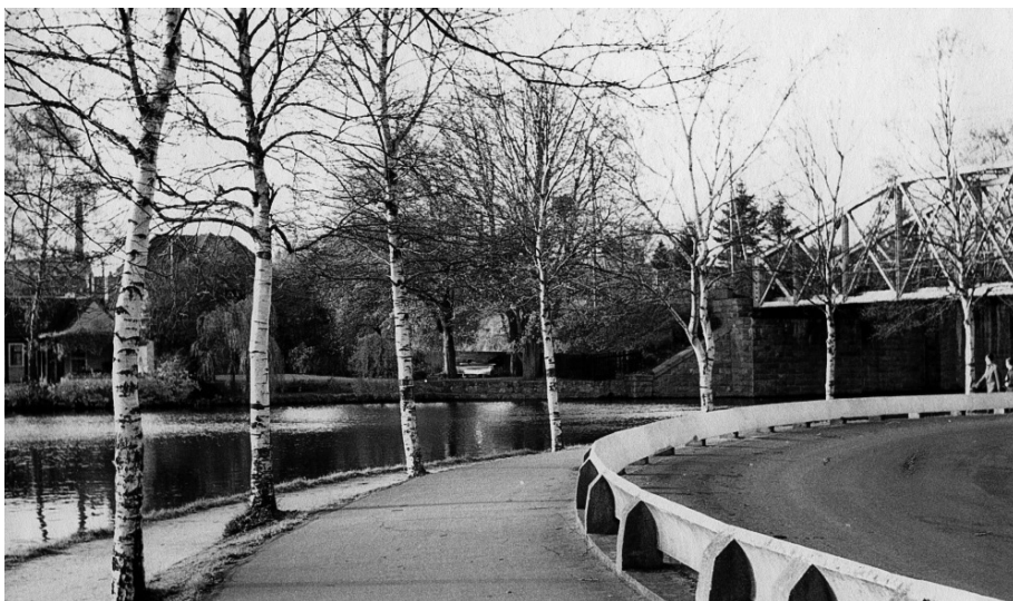
Figur 4. Nogle af de første autoværn blev opsat i DAV's hjemby, Silkeborg, som dette i et sving ved Sejsvej.