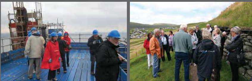
Studieturene er populære. Tv. beses toppen af Forth Bridge i Skotland bygget 1882-90; th. hører deltagerne fortælling om transport på Færøerne.

Mød andre historisk interesserede i Dansk Vejhistorisk Selskab